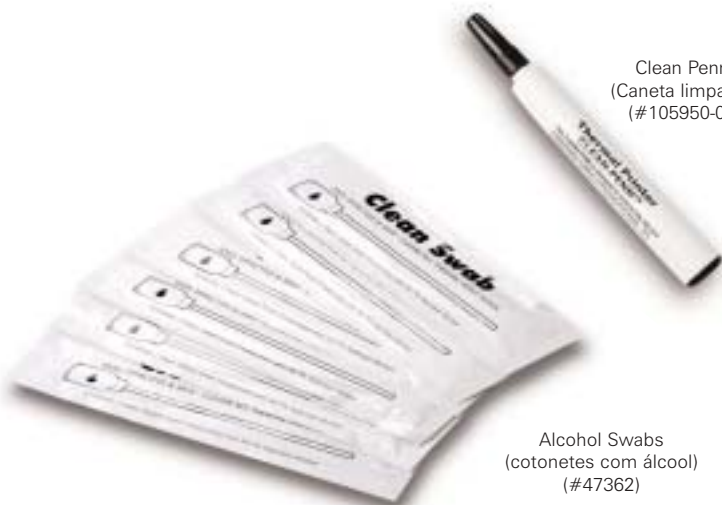
Clean Penn™ (Caneta limpadora) (#105950-035)

Para obter os melhores resultados, siga as instruções impressas no verso deste cartão, e use somente os produtos de limpeza genuínos Zebra: