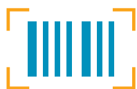
Códigos de barras