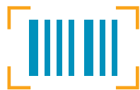
Códigos de barras